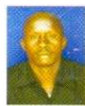
BAHATI LIGODISHA GEITA

UJUMBE WA MWENGE; "SHIRIKI KUKUZA UCHUMI WA VIWANDA KWA MAENDELEO YA NCHI YETU"