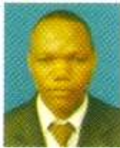
SHUKRAN ISLAM MSURI MJINI MAGHARIBI